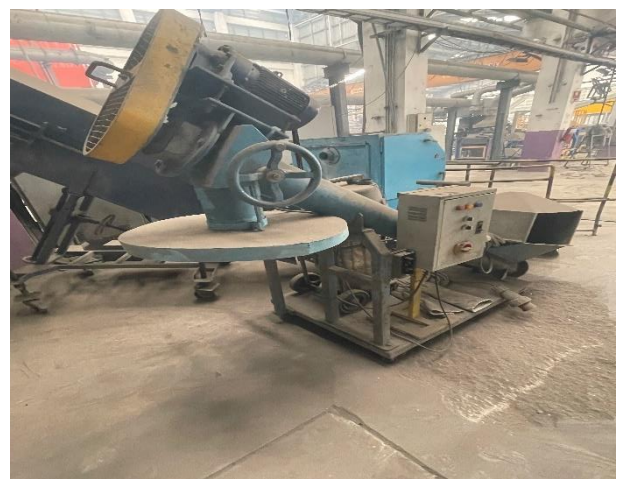
ชุดที่ 4 Mobile Unit