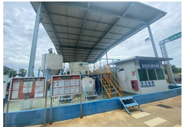
รูปที่ 2.1-11 ระบบบำบัดน้ำเสียทางเคมีของโครงการ