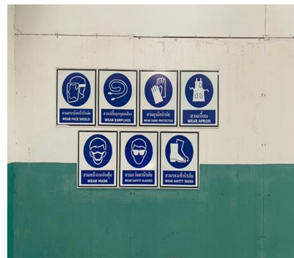
รูปที่ 2.1-34 ป้ายเตือนการสวมใส่ PPE ในบริเวณที่ทำงานที่มีความเสี่ยงสูง