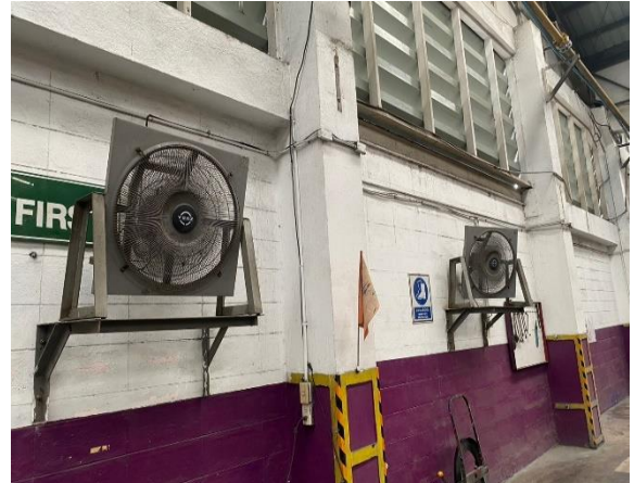
รูปที่ 2.1-26 พัดลมระบายอากาศในอาคารผลิต