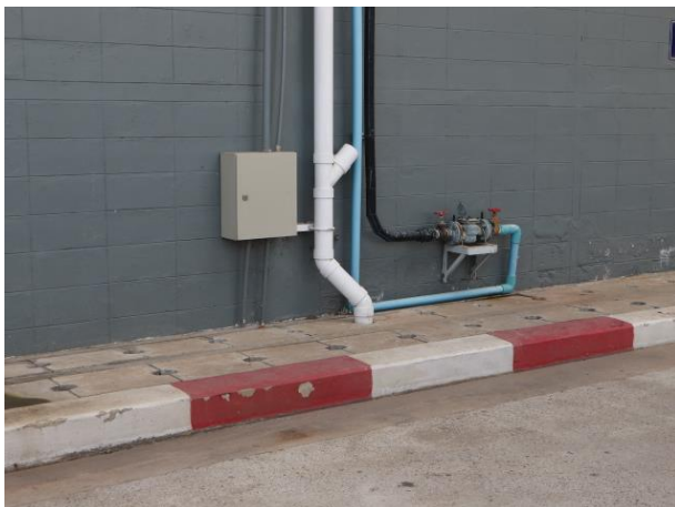
รูปที่ 2.1-18 รูปท่อรวบรวมน้ำฝนไม่ปนเปื้อน