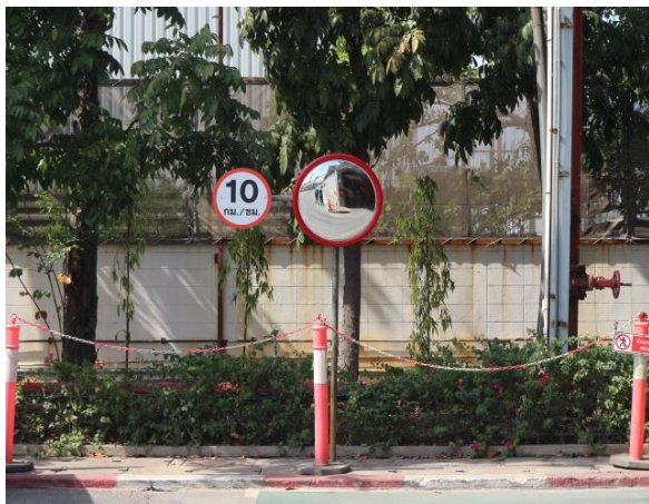
รูปที่ 2.1-4 ป้ายจำกัดความเร็วรถภายในโครงการ