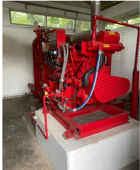
รูปที่ 2.1-36 ระบบเครื่องสูบน้ำดับเพลิง ระบบ Vertical pump