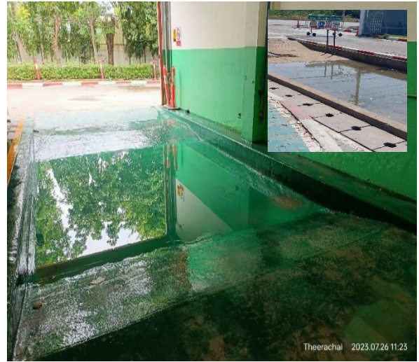
รูปที่ 2.1-15 บ่อล้างล้อบริเวณห้องเก็บซากแบตเตอรี่ และบริเวณหน้าโรงงาน