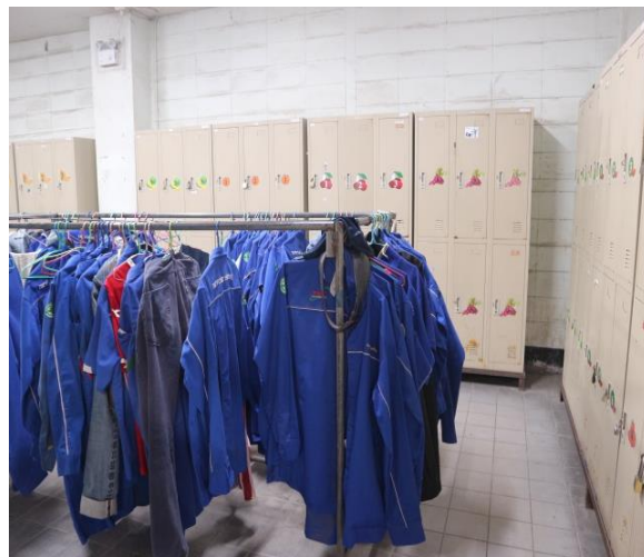
รูปที่ 2.1-31 ห้องซักเสื้อผ้าพนักงาน