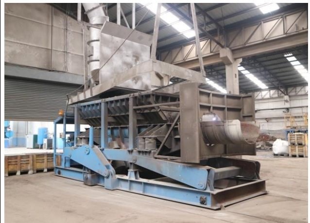
รูปที่ 2.1-3 TRF charger