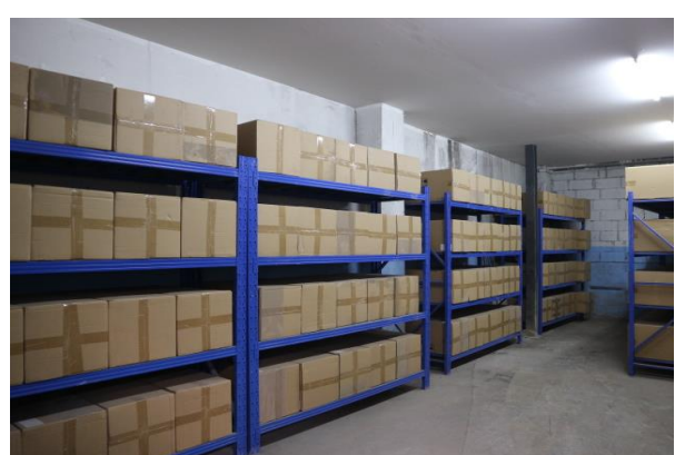
รูปที่ 2.1-7 ห้องเก็บถุงกรองสำรอง