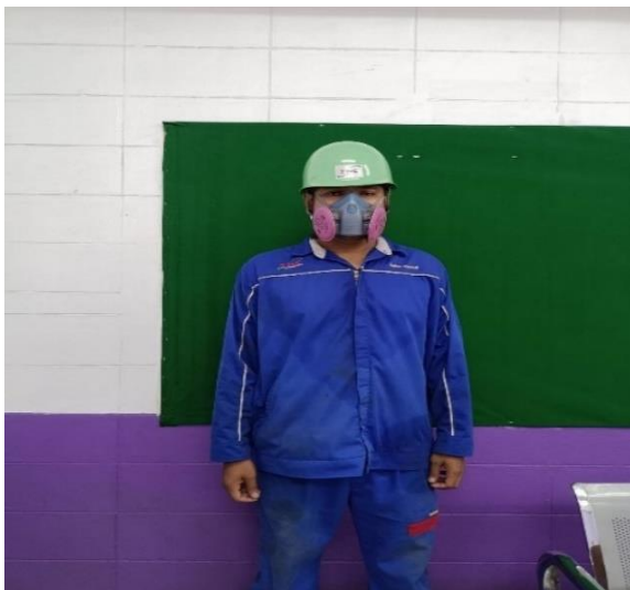
รูปที่ 2.1-24 หน้ากากป้องกันฝุ่นตะกั่ว