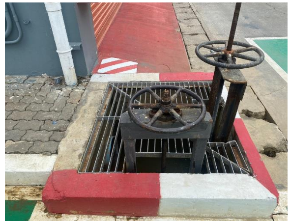
รูปที่ 2.1-17 รูปท่อรวบรวมน้ำฝนบนเพ็อน ก่อนเข้าระบบบำบัดน้ำเสีย