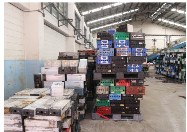
รูปที่ 2.1-13 พื้นที่เก็บแบตเตอรี่เก่า