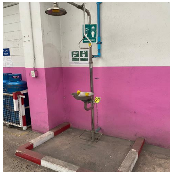
รูปที่ 2.1-30 ที่ชำระล้างสารเคมีอันตราย ที่ล้างมือและล้างหน้า