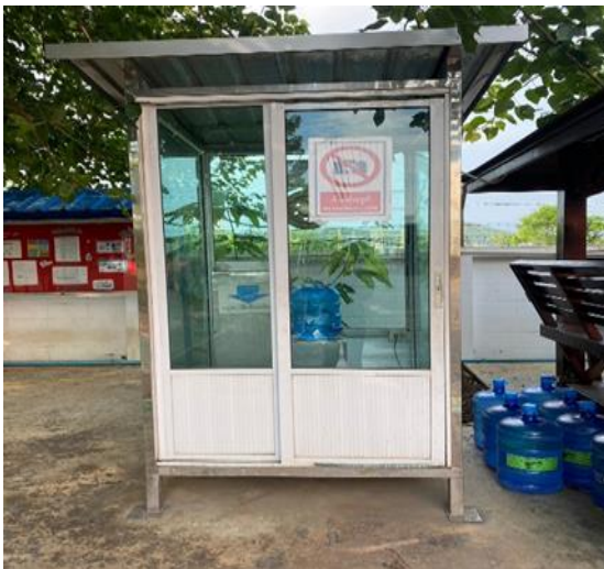
รูปที่ 2.1-39 จุดบริการน้ำดื่ม ห้องน้ำ และสวัสดิการต่างๆ