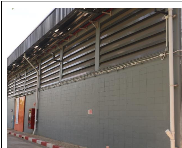
รูปที่ 2.1-8 ผนังอาคารโรงงาน