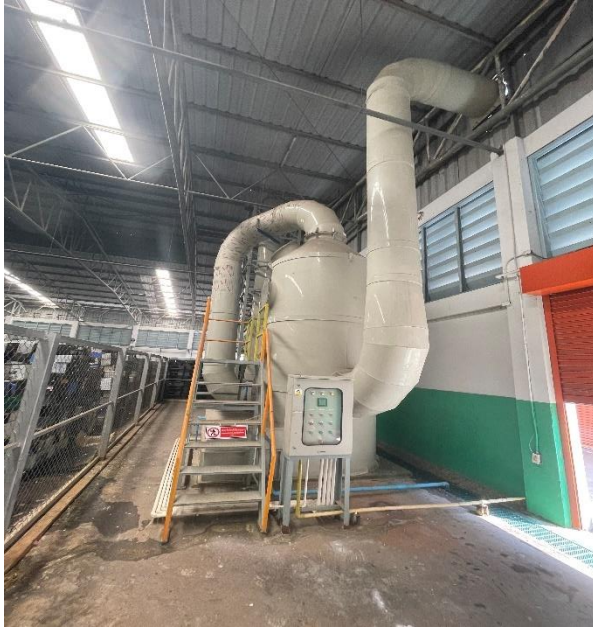
ชุดที่ 1 (Breaker Line)