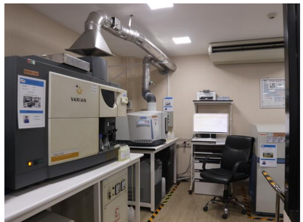
รูปที่ 2.1-19 ICP ในห้องปฏิบัติการของโครงการ