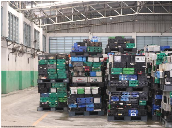
รูปที่ 2.1-16 การจัดวางแบตเตอรี่ ในห้องเก็บซากแบตเตอรี่เก่า