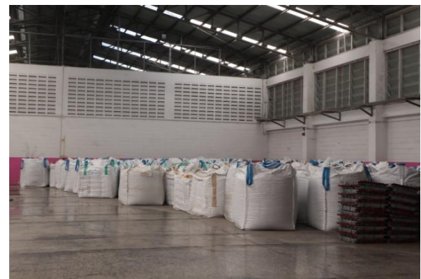
รูปที่ 2.1-23 ที่เก็บเศษไม้/พาเลทชำรุด และ เศษพลาสติก PP (Polypropylene Chip)