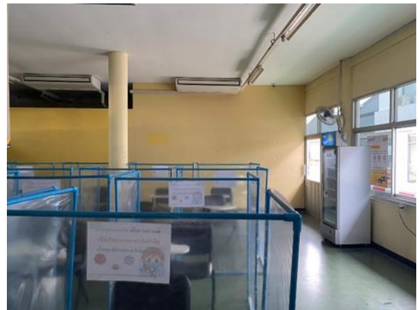
รูปที่ 2.1-40 โรงอาหารที่ปิดมิดชิด และมีระบบปรับอากาศภายในห้อง