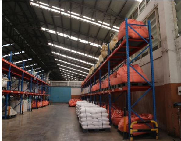
รูปที่ 2.1-25 การวางวัตถุดิบในห้องเก็บวัตถุดิบ และการเก็บ เนื้อแผ่นธาตุตะกั่วจากการทุบแบตเตอรี่