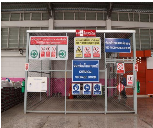
รูปที่ 2.1-29 ป้ายห้าม ป้ายให้ปฏิบัติ หรือป้ายเตือนความปลอดภัยของสารเคมีอันตราย