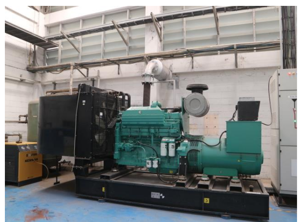
รูปที่ 2.1-5 ระบบไฟฟ้าสำรอง