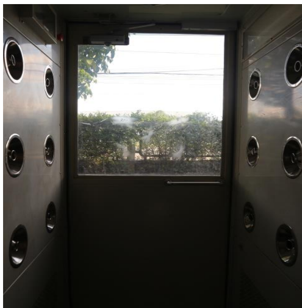
รูปที่ 2.1-33 ตู้ Air shower บริเวณโรงอาหาร