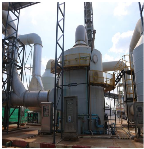
ชุดที่ 2 TRF&Kettle