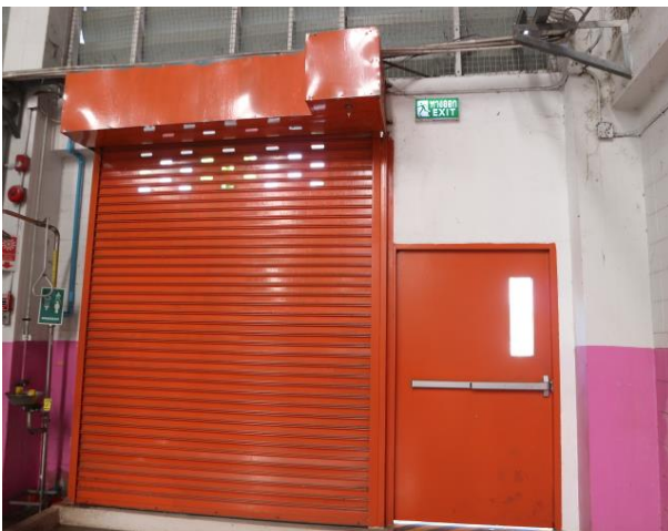
รูปที่ 2.1-37 ทางเข้าออกฉุกเฉินพื้นที่การผลิต