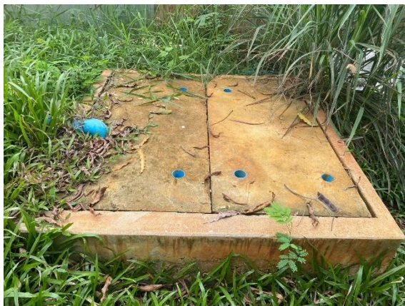
รูปที่ 2.1-10 ท่อระบายน้ำของอาคารซักล้าง