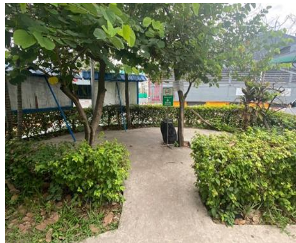
รูปที่ 2.1-38 เขตสูบลบห้