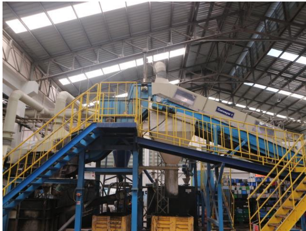
รูปที่ 2.1-2 ชุด Battery Breaker System