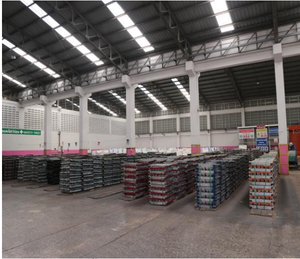
รูปที่ 2.1-14 พื้นที่ของห้องต่างๆภายในอาคารโรงงาน