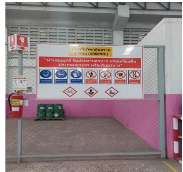
รูปที่ 2.1-32 ป้ายเตือนห้ามสูบบุหรี่