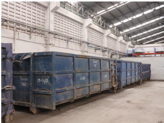
รูปที่ 2.1-22 ตัวอย่างการเก็บรวบรวมของเสียอันตราย