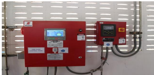
รูปที่ 2.1-35 ระบบดับเพลิงแบบสายสูบล