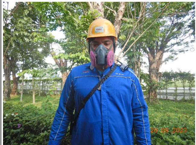
รูปที่ 2.1-24 หน้ากากป้องกันฝุ่นตะกั่ว