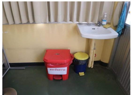
รูปที่ 2.1-21 ถังขยะ 200 ลิตรสำหรับขยะ 4 ประเภท