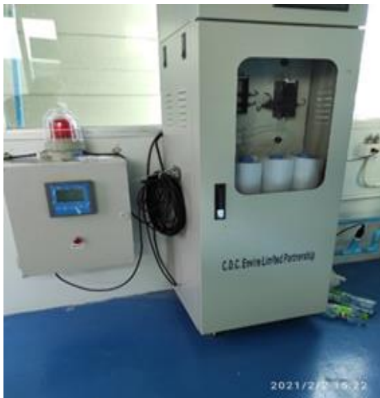
รูปที่ 2.1-20 เครื่องตรวจตะกั่วและ TDS ระบบอัตโนมัติ