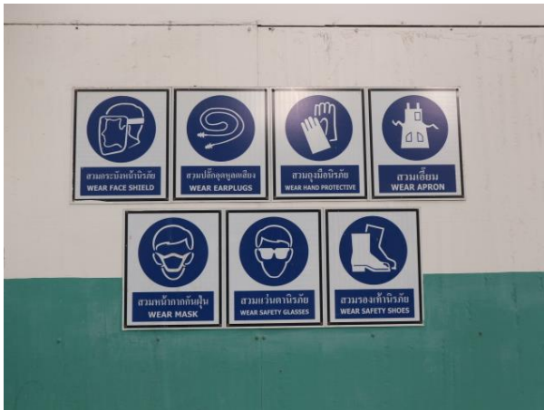
รูปที่ 2.1-27 ป้ายเตือนด้านความปลอดภัยในอาคารผลิต