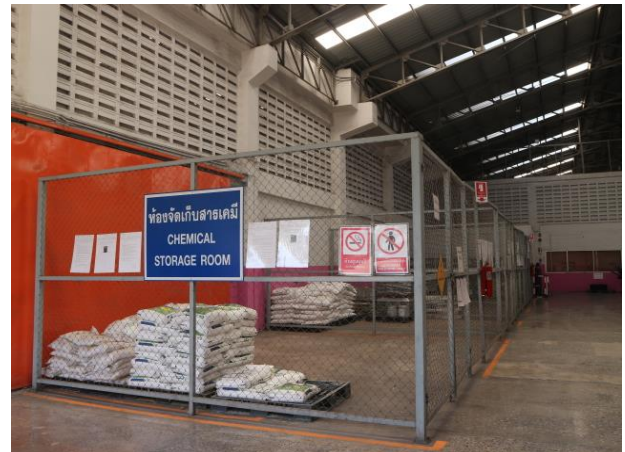
รูปที่ 2.1-28 การเก็บสารเคมีภายในอาคารผลิต