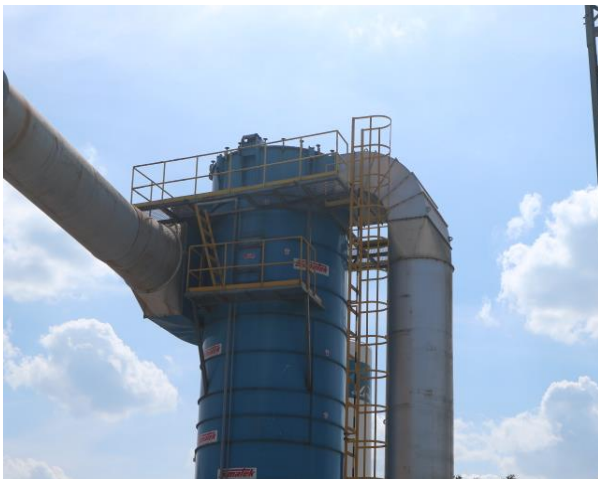
ดที่ 3 Charger & Slag Cooling Line