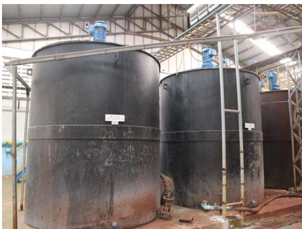
รูปที่ 2.1-12 ระบบบำบัดน้ำกรด Electrolyte Treatment Plant